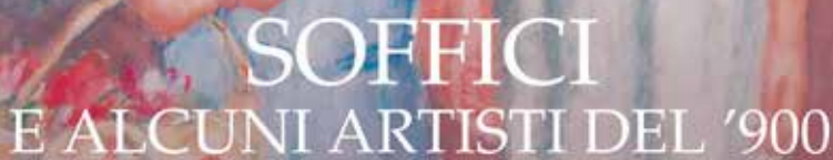
Figura per figura

MUSEO SOFFICI C.F. 80016030502 POGGIO A CAIANO